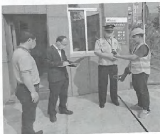
赓续五四精神，立足岗位做奉献