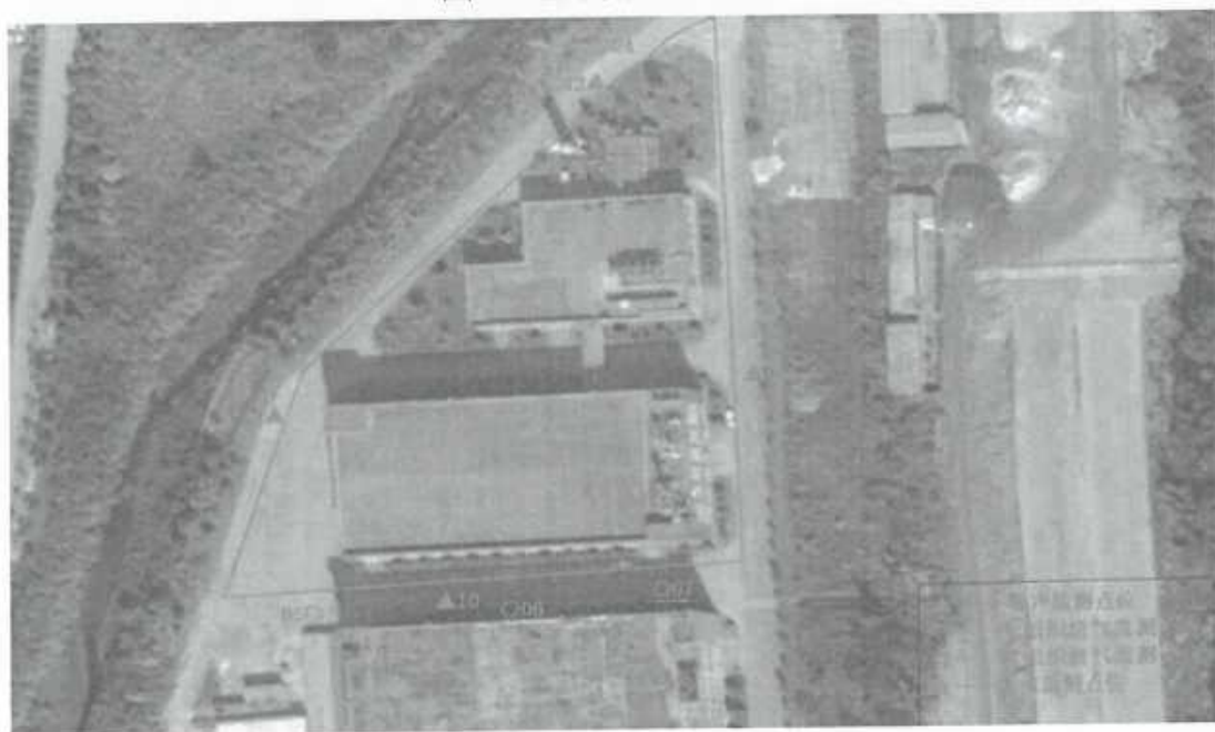
图 4-2 监测点位图