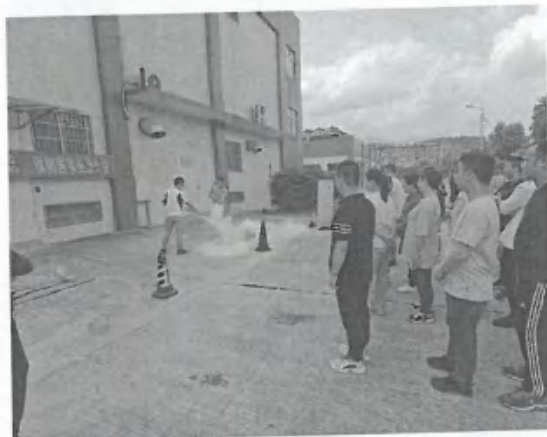
全民国家安全教育日专题宣传教育活动