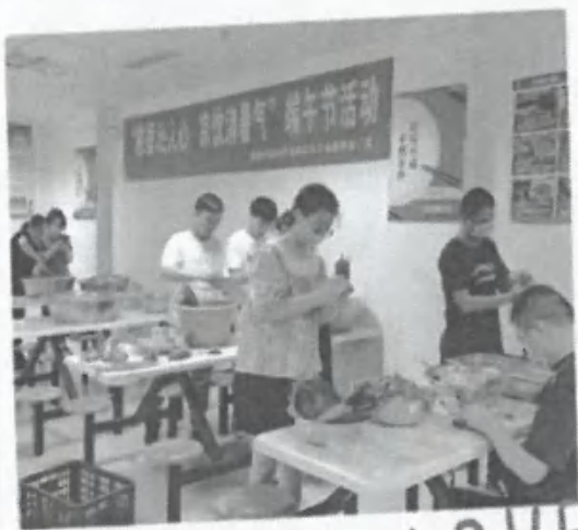
“粽香沁人心，凉饮消暑气”端午节活动