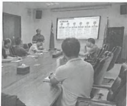
“安全生产月”系列主题活动