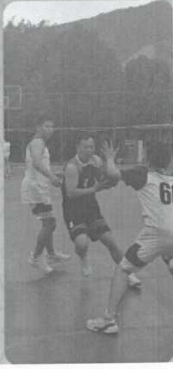
首届三人制职工趣味篮球赛