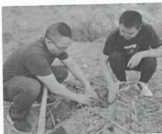
开展“传承雷锋精神 践行初心使命”学雷锋系列活动